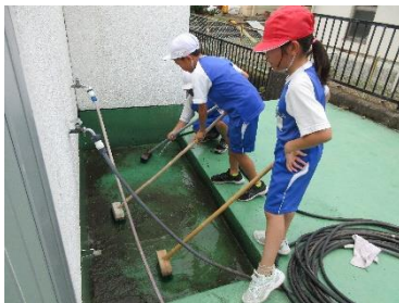
プールサイドの隅々まで磨く子どもたち

子どもたちは、19日から水泳学習を始めております。昨年に引き続き、低学年・中学年・高学年で、無理なく安全に泳ぐためのめあてを設定し、複数の目で見守りながら、学習指導を進めているところです。水の中での学習は、思いの他、体力を使います。夜は早めに休み、十分な睡眠がとれるよう、ご家庭でのご協力をよろしくお願いいたします。